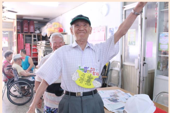
▲中原大學志工同學們為爺奶們帶動活潑可愛氣氛。

這場由本校服務學習中心與弘道老人福利基金會共同合作，進入桃園縣龍潭鄉中興社區舉辦「Young 寶寶的奇幻旅程」營隊，較為特殊的是本次活動透過服務學習攜手合作，帶動振聲高中及社區小學生參與服務學習，體驗服務學習的真諦，在心中種下愛的種子。除此之外，本次所服務的中興社區也將此活動視為以後舉辦營隊的範本模組，希望在未來可以融合更多不同的族群，為中興社區的爺爺奶奶帶來不同的回憶。