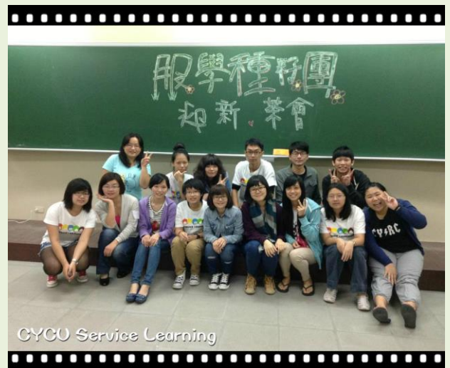
CYCU Service Learning