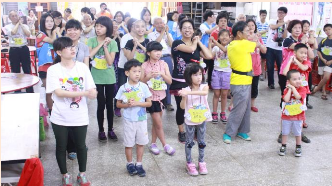
▲中原大學志工們與爺奶們一起進行帶動跳。

三天營隊活動中，學生志工們設計遊戲，由高中生及小學生陪伴長輩進行闖關遊戲，不僅讓年輕的活力感染爺爺奶奶的心靈，也教育年輕族群「孝」的觀念；另外，活動也規劃由年長者擔任老師，指導高中生和小學生製作客家菜包及包水餃的「家政課」，將家鄉味傳承給年輕的世代。透過雙向交流讓兩個世代相融，體驗彼此的文化，瞭解對方的生活。志工們還準備了「帶動跳」讓長輩活動筋骨；「金嗓歌唱大賽」給愛唱歌長輩最棒的舞台，最後更讓長輩以及小朋友一起上台演出共同排演的寓言故事小短劇，在充滿歡笑與感動中為三天的營隊活動畫下完美的句點。