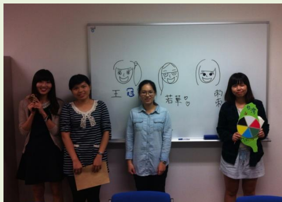
▲關西大學女孩(左1)以手繪三位志工的頭像與志工們交換台灣文化吊飾。

關西大學另一位女同學從小就很愛畫畫，所以她想要為三位志工畫下專屬頭像當作交換的禮物，雙方都很珍惜能藉由這次的機會認識對方、接觸對方的文化。另一則有趣的故事，則是一位日本街頭的男生，願意拿出一副眼鏡與志工交換一塊吊飾板，女孩們好奇著，為什麼願意拿眼鏡來交換呢？原來這副眼鏡是男孩與他的前女友一起旅行時，女友送他的禮物，可如今兩人分手了，為了不再睹物思情，這個男孩決定把它捐出來給台灣需要的朋友。男孩挑了塊上面有通訊軟體ID的木塊，笑著說：「可以用這個前女友送的眼鏡換來一個新朋友嗎？」志工們笑著說：「Of course！祝你幸福！」