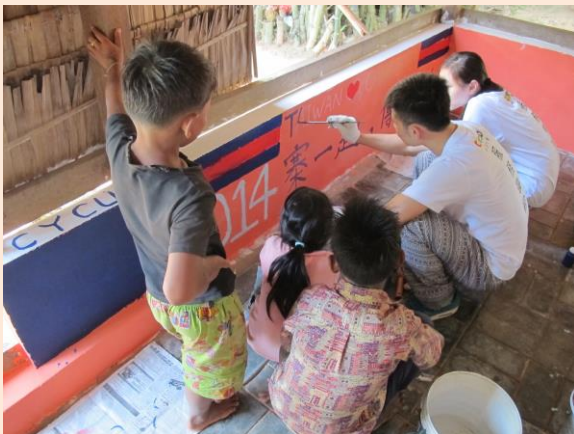
▲中原大學志工同學們為柬埔寨村落圖書館進行牆壁彩繪、環境美化。 此行志工同學們為柬埔寨村落圖書館進行

本團是由國貿系五位同學所組成，他們帶著滿腔熱忱，離開繁華的都市，前往柬埔寨偏鄉地區進行服務。柬國的知識份子在紅色高棉統治時期大量消失，教育及各類的資源因此缺乏，志工同學們看到這個現況，因此決定至柬埔寨進行文化服務，希望能幫助柬國文化提升，培育小幼苗變成林蔭的大樹。