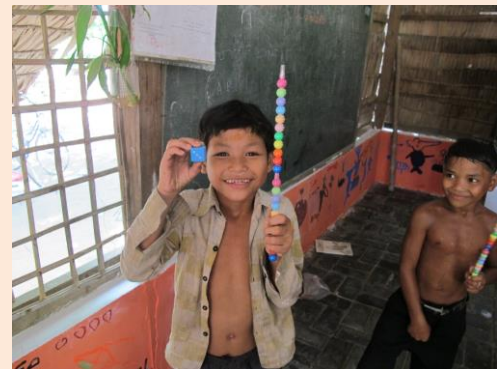
▲中原大學志工同學們為柬國學童帶動活潑可愛氣氛。

環境美化，將具有意義的圖樣繪製於圖書館牆面。志工同學們表示：「想透過像奧運旗幟等世界性圖樣帶給他們世界觀，讓柬埔寨的孩子認識這個世界；透過牆面粉刷將知識的種子帶入他們的生活環境中，因此選擇英文字詞及相關圖案作為題材，例如字彙 Apple 與蘋果，希望在我們離開後，他們仍能隨時看到這些字樣，潛移默化地記住這些英文。」