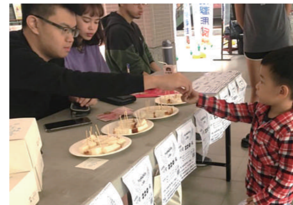
資管系同學以實際行動擺攤義賣天使蛋糕。

成果發表會中同學們分享彼此的學習與感受，相信這些難得的經驗也會化為種籽種入下一屆資管系的學弟妹身上，讓他們再次透過專業進行服務，綻放出絢爛花朵，永存心中。