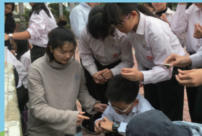
景觀三同學帶領大甲國小學生體驗馬賽克拼貼。

在這幾小時拼貼過程中，更獲得當地人的肯定與稱讚。許多當地人看見逐漸成形的磁磚牆都紛紛豎起大拇指，不論是放學回家和父親說：「把拔，你看好漂亮！」的小女孩，還是來操場運動的退休老師對團隊說：「這對大甲國小是一種很棒的行銷！」都是在見證這四面牆的重生，更喚起了當地人心中對家鄉的愛與微笑。