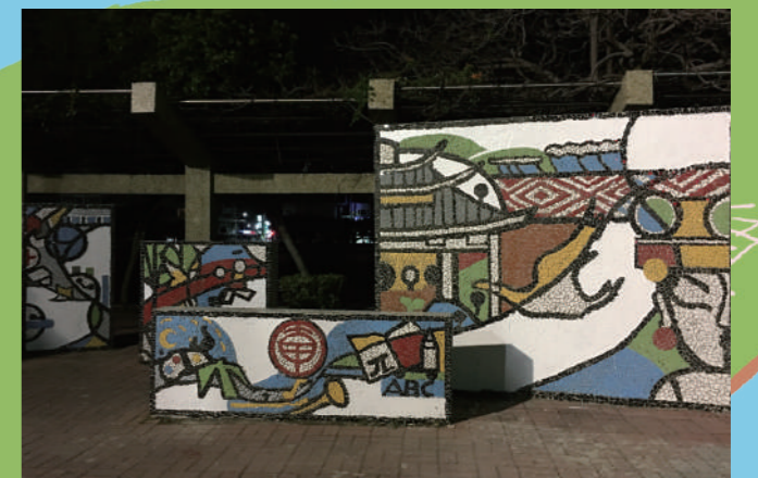
歷時近十小時，大甲國小大門口的公共藝術「Beyond 超越」終於完成。