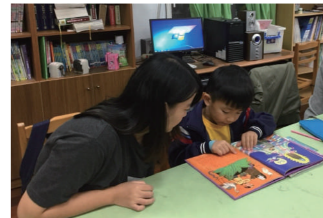
帶領孩童寫完功課後，陪伴孩童閱讀課外讀物。

「生命關懷與實踐」是蔡秀玲老師所開設的服務學習通識課程，在 107 學年度第一學期的期末成果發表會上，同學們輪流上台分享，在為期六週伴讀的過程裡，其所獲得的體悟與成長。