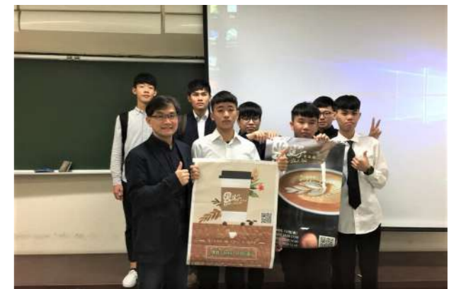
資管系同學為黑孩子黑咖啡製作的活動海報。