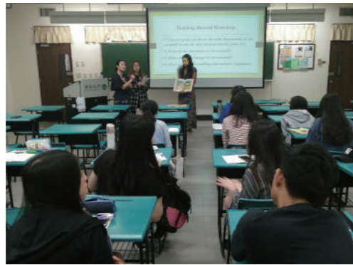
服務前應華系同學們於課程中學習教案設計。