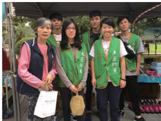
資管系同學幫助木匠之家擺攤義賣。

這門「管理學」課程帶給同學們的，除了管理學的理論和實務經驗外，最寶貴的，就是真心付出並投入其中的感動，與把感動一屆一屆傳承下去的使命。