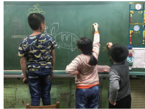
新二代的小朋友們於課程中作畫玩遊戲。