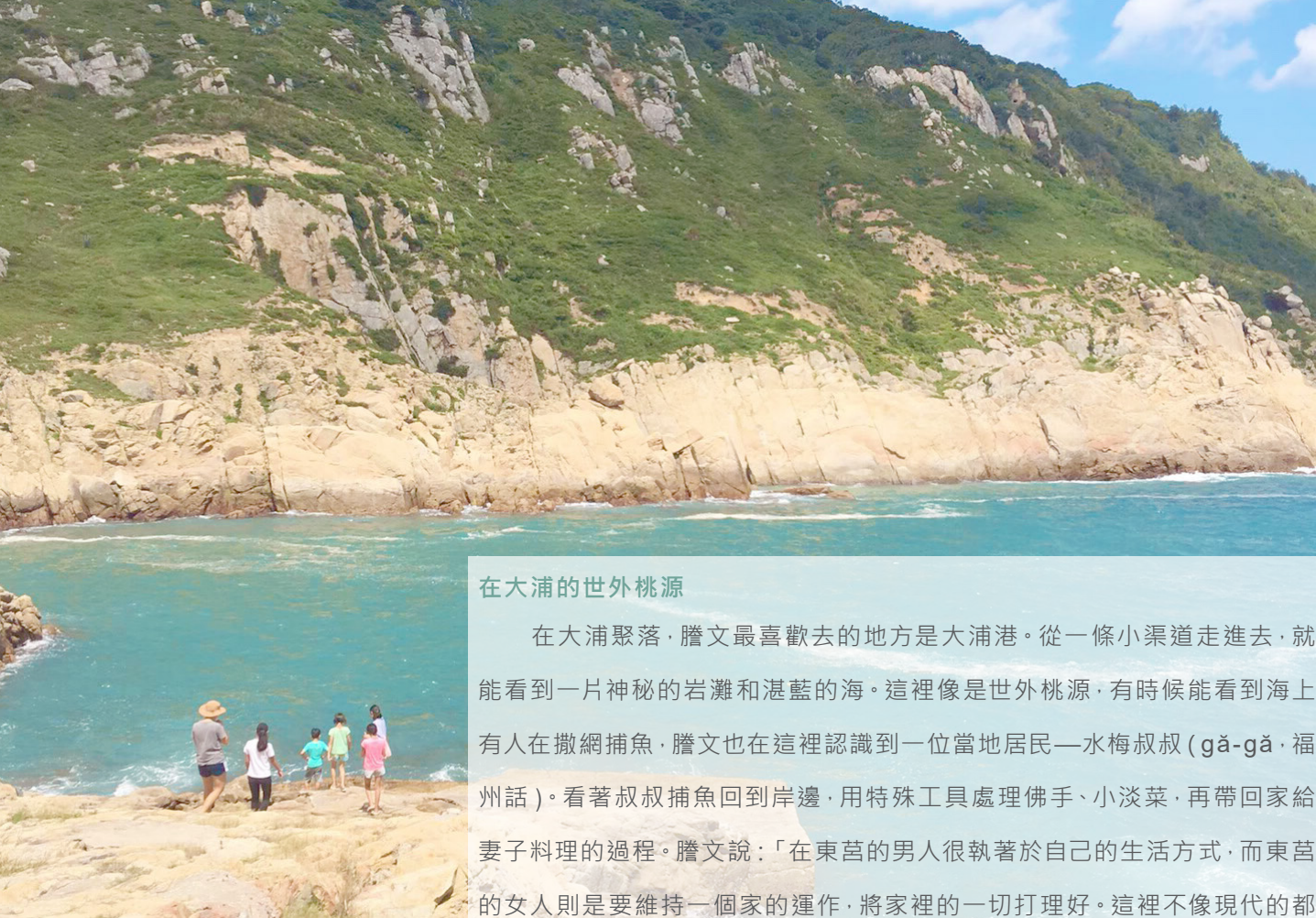
▲ 在大浦港旁有一塊小小的正方形平台可以讓人踏踏浪。