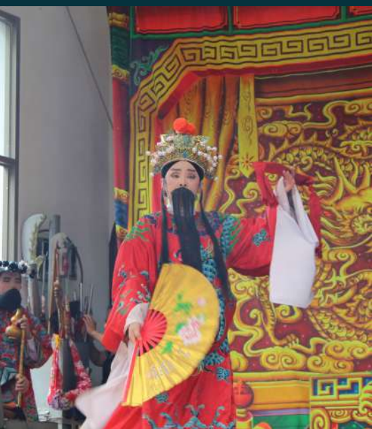
▼ 義民節演出酬神的平安戲—八仙故事

農村行銷志工團於 8 月 20 日參加田寮村特色的客家節慶—義民節，深入瞭解當地的客家文化。據當地村民口述，「義民」指的是客家人組成的義勇軍，在康熙乾隆時代為了捍衛家土，起身反抗盜匪。為了紀念義民壯烈犧牲，而在每年的農曆 7 月 20 日舉辦義民節。因此，義民廟對客家人來說不僅是一座廟，更是凝聚客家人的精神表徵。田寮村義民節舉辦的活動包含普渡、拜天公、酬神平安戲及神豬比賽等。其中的神豬比賽，是村民們最期待的活動，參與神豬比賽的飼者，會在 3 到 4 年間將豬隻養得肥嫩，期望豬隻能拔得頭籌並以酬謝神的保佑。在酬神結束後肉品也會分送給家家戶戶食用，透過節慶，總能將村民聚集在一塊，聯絡村民彼此間的情感。