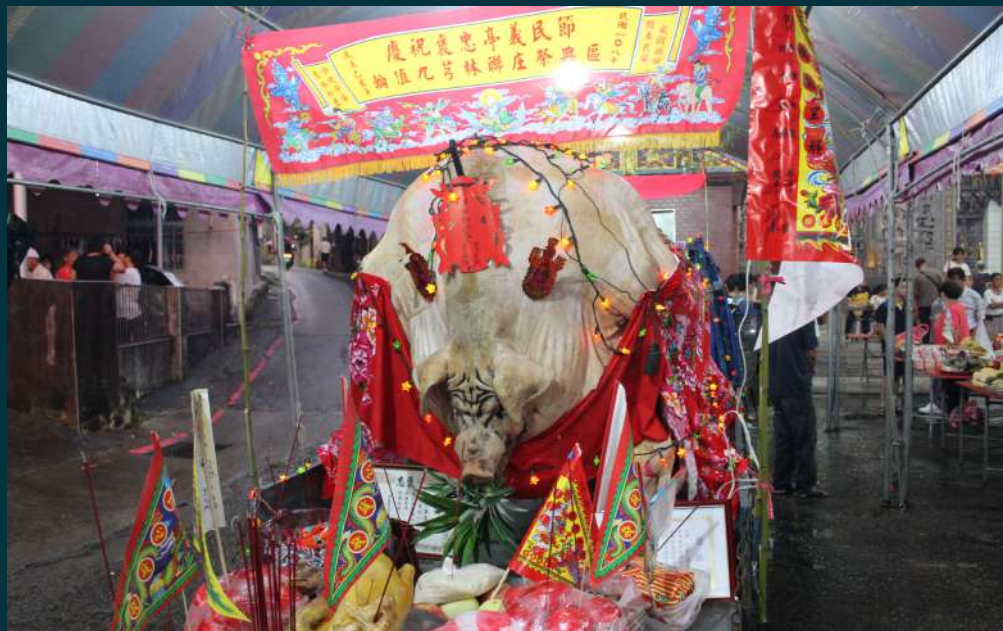
▲ 義民節神豬祭物，以酬謝神明庇佑