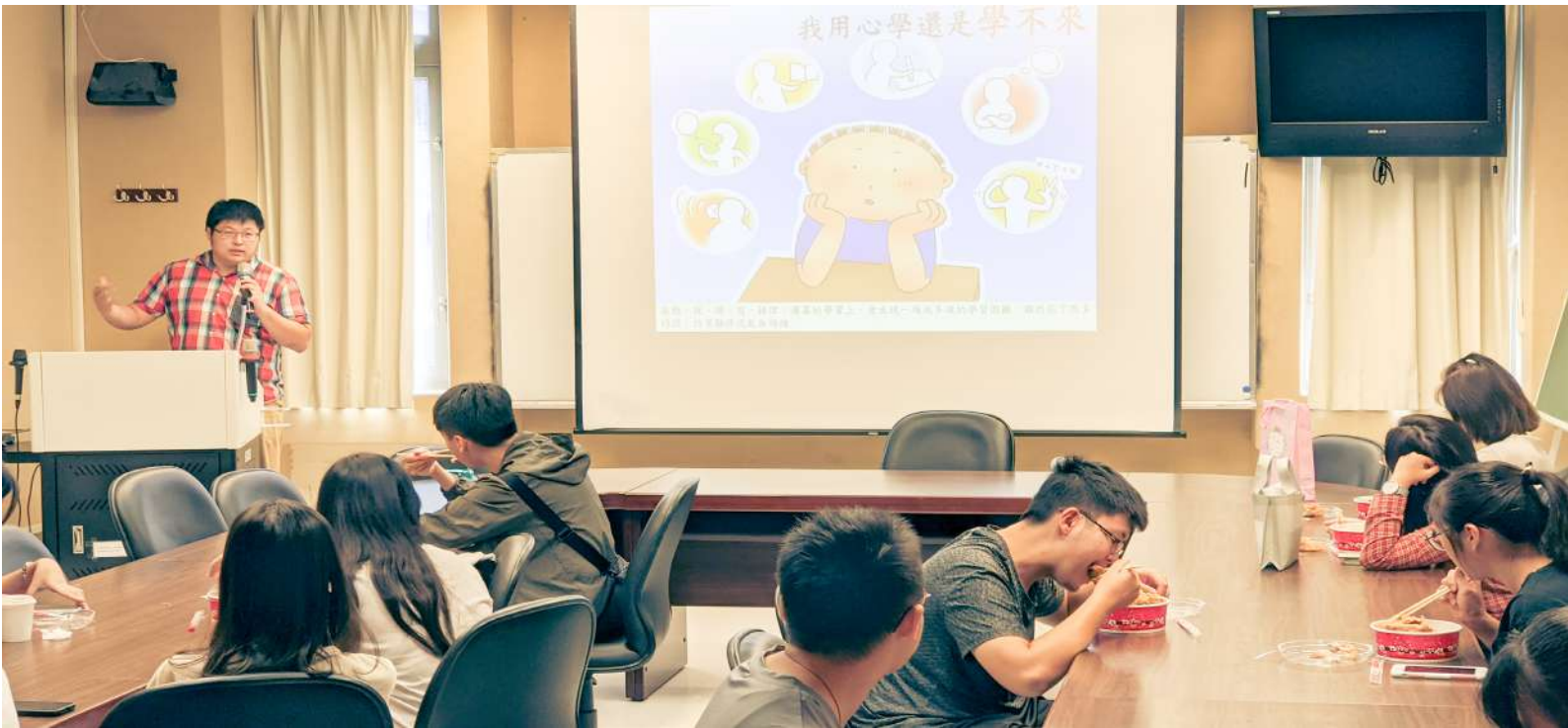
▲ 天使學伴期初會議與知能培訓