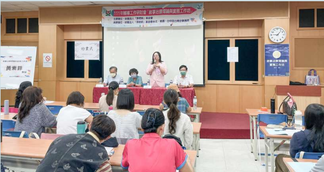
舉辦「敘事治療理論與實務工作坊」活動照

現在的「張老師」不只有電話、函件等諮詢服務，也有許多工作坊課程以及義務張老師的培訓，在暑期也會舉辦針對青少年的自我挑戰營，提供民眾多樣的心理關懷資源。