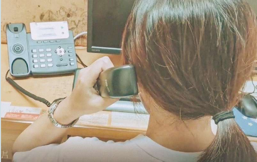
張老師 1980 專線服務