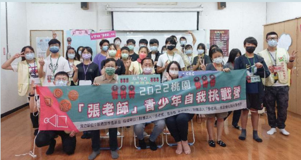
中壢「張老師」中心於今年舉辦的青少年自我挑戰營