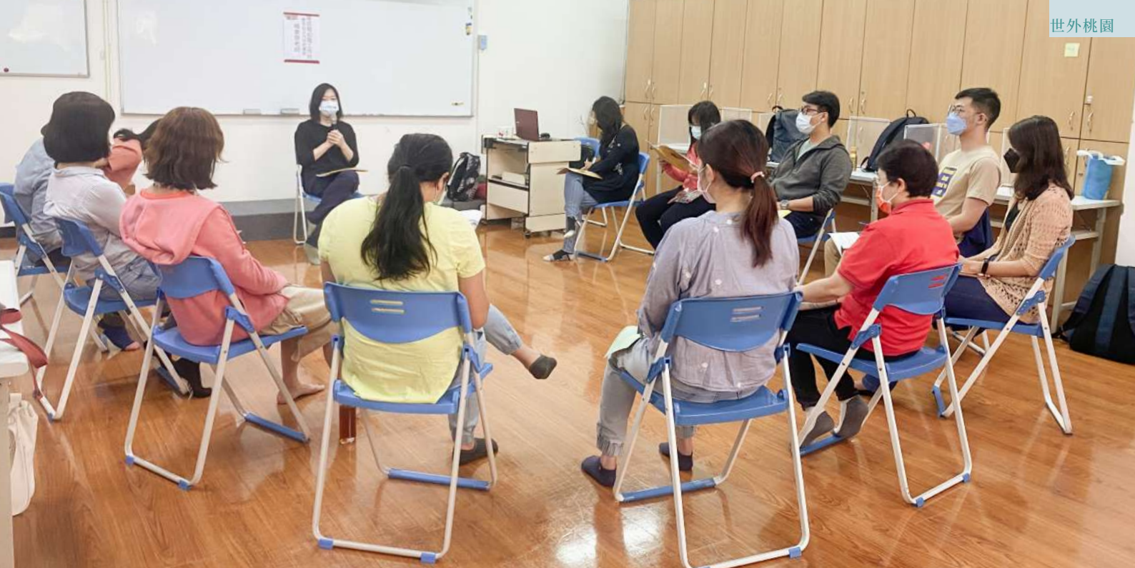
▲ 民眾參與心理學苑活動